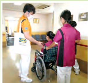
尼崎市立日新中学校の生徒さん

超高齢社会に伴い、若い人たちに、医療・介護における現状とこれからの重要性を直に正しく知っていただくために、大隈病院では、学生さん達の当院への訪問研修を受け入れています。(感染予防対策をとりながら) 12月1日には、尼崎市立日新中学校2年生の生徒さん3名を、また、12月21日に尼崎市立尼崎高等学校1年生の生徒さん8名が当院を訪れ、院内見学や車いす体験、グループワーク検討などを行いました。きっと、自分たちのこれからの進路などを考える上での大きな体験になったことでしょう。