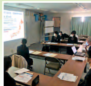
尼崎市立尼崎高等学校の生徒さん