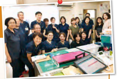
南部事務所のスタッフ

詳しく知りたい、相談に乗ってほしい等、医療から介護のことまで専属スタッフが、親切丁寧にお答えしますので、大隈病院受付またはホームページにてご連絡下さい。