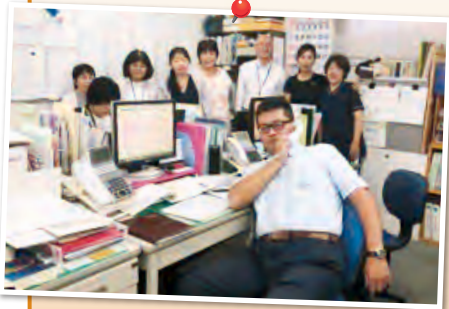
北部事務所のスタッフ