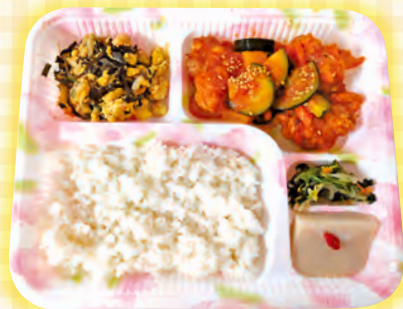
「ヤンニョムチキン」

当日は、学生さんがメッセージカード付きのお弁当を手渡ししてくれました。普段と違う顔やメッセージカードに、利用者の方はとても嬉しそうでした(^^)。これからもみなさんから喜んでもらえるよう、さまざまな取り組みをおこなっていききたいと思います。