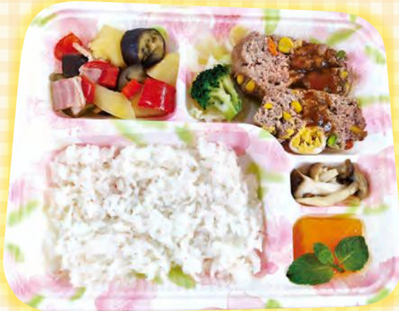
「やわらかミートローフ」